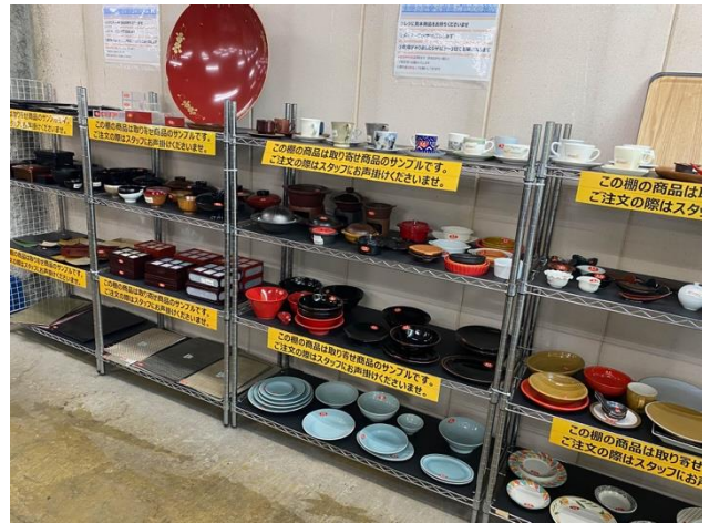
食器だけでも500点以上がずらりと並び（写真はなんば店）