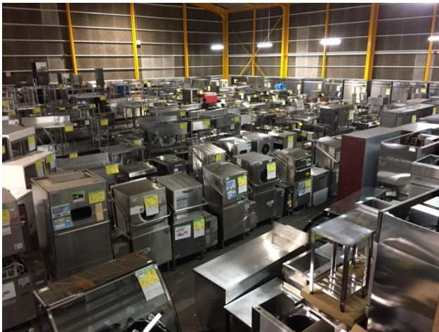
所狭しと並ぶ厨房機器の数々（写真は福岡店）